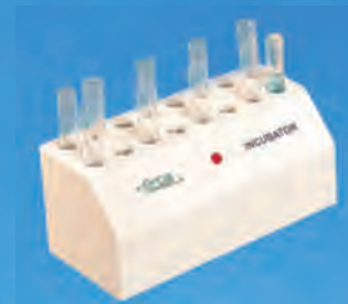
Термостат на 16 ячеек