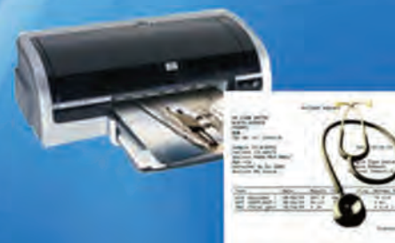
Распечатка отчетов на внешнем принтере